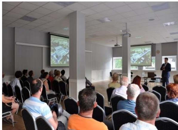
Rysunek 4. Zdjęcia z debaty bezpośredniej zorganizowanej w ramach konsultacji.