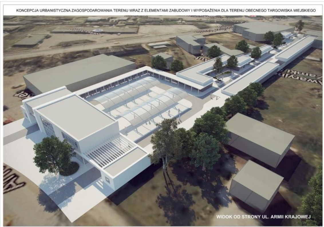
Rysunek 1. Wizualizacje targowiska miejskiego po przebudowie.