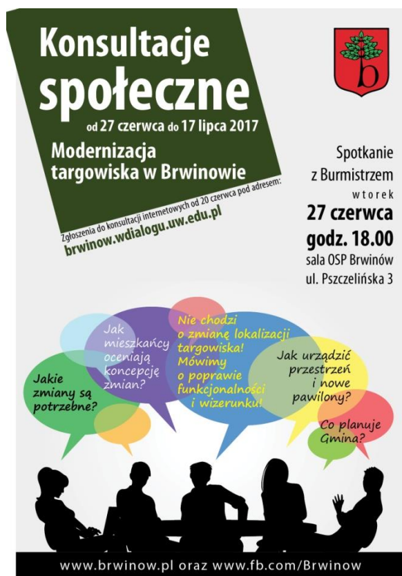
Rysunek 3. Plakat informujący o konsultacjach.