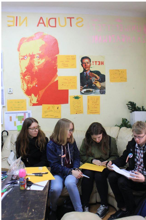
Zdjęcia 1 i 2. Uczestnicy gry w IS UW