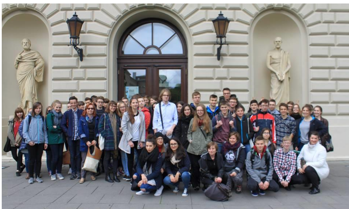
Zdjęcie 3. Uczestnicy gry przed dawnym budynkiem BUW

W sumie w grze wzięło udział około 70 uczniów podzielonych na 16 cztero- pięcioosobowych grup. Uczestnicy wyznaczone im zadania realizowali samodzielnie, bez pomocy opiekunów i nauczycieli, przez co mogli wypracować własne metody współpracy w małych grupach i zintegrować się z uczniami z innych szkół. Sami wybierali również nazwy grup, zadania do realizacji oraz ich kolejność. Celem gry było więc także rozwijanie umiejętności interpersonalnych i komunikacyjnych, zarówno w grupie rówieśniczej, jak również w stosunku do obcych, starszych od siebie osób. Dlatego niektóre zadania wymagały kontaktu z napotkanymi studentami - przeprowadzenie krótkiej sondy (badania opinii w kwestii przestrzeni wokół UW) pozwalało na zapoznanie się z podstawami pracy socjologa, dawało także możliwość porozmawiania ze studentami Uniwersytetu Warszawskiego. Wszystko to stanowiło również o wychowawczym aspekcie przeprowadzonej przez nas gry miejskiej.