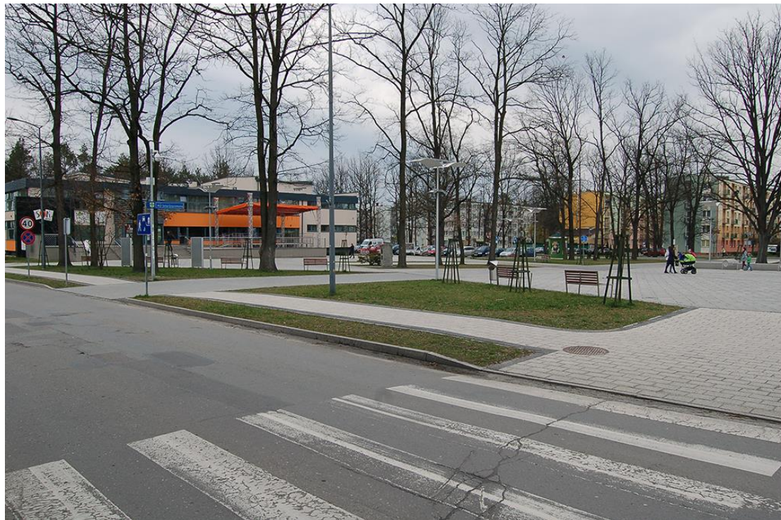
Zdjęcie 2. Wjazd w ulicę Żeromskiego od strony ulicy Krasickiego.

Na zdjęciu, na pierwszym planie widoczny jest znak strefy zamieszkania. Na dalszym planie widoczna jest kamienna nawierzchnia.