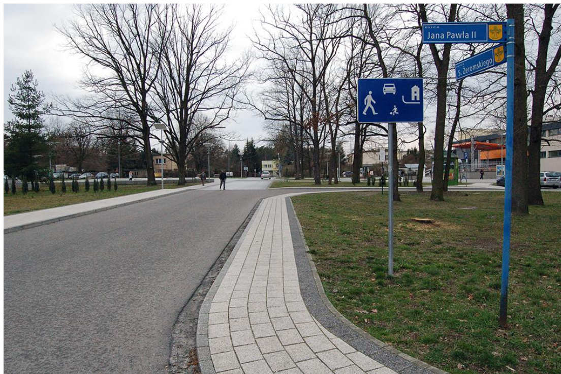
Zdjęcie 1. Widok ul. Żeromskiego od strony ul. Jana Pawła II.

Na zdjęciu, na pierwszym planie widoczny jest znak strefy zamieszkania. Na dalszym planie widoczna jest kamienna nawierzchnia.