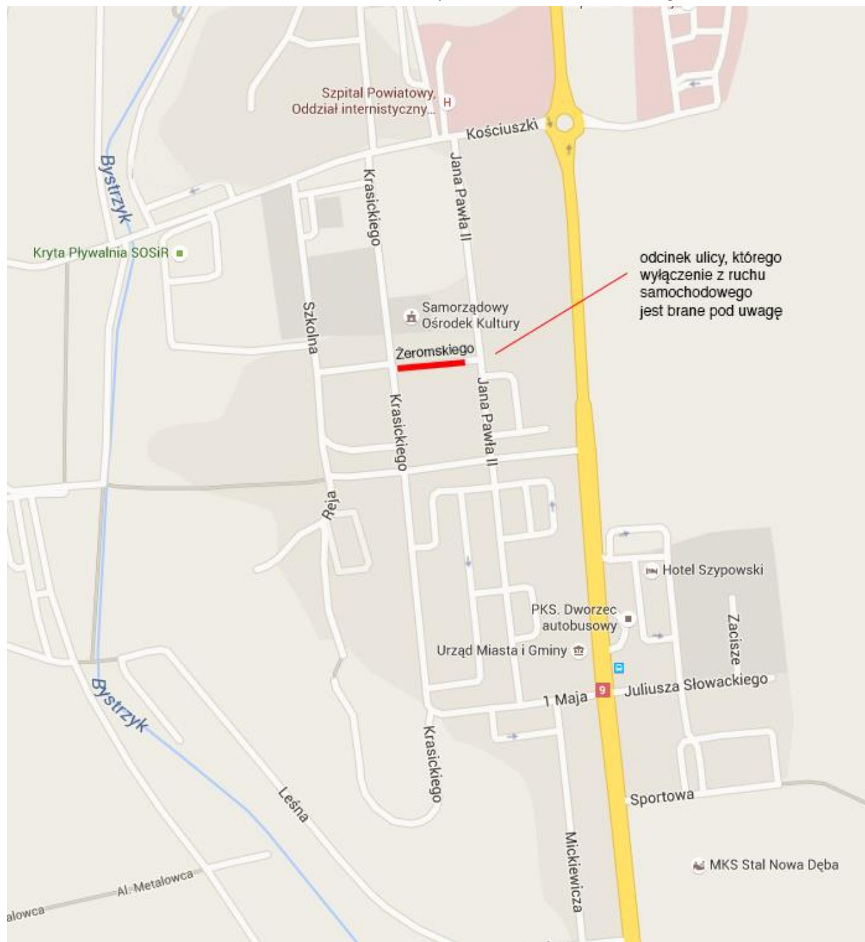
Schemat 1. Układ ulic w centrum miasta z zaznaczonym odcinkiem ul. Żeromskiego.